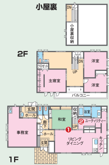
【小八木モデルハウス】

高崎市小八木町に新春オープンするモデルハウス。小屋裏収納(4.8畳)を備えた家事に便利な長期優良住宅で、高気密・高断熱によって一年中快適な住み心地。高品質の適正価格住宅を希望する子育て世代、ゆとりのある健康住宅を望む親世代にも見どころがいっぱい。