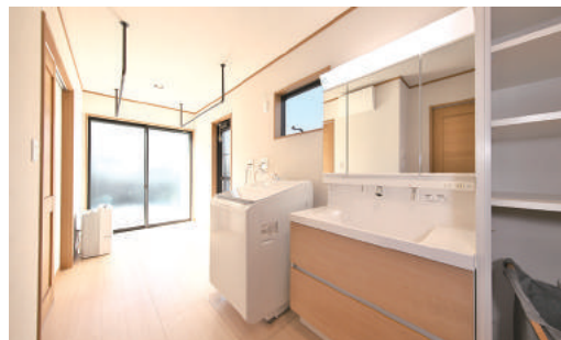
広いスペースを確保したサンルームと洗面脱衣室。大型の洗濯機を配置し、大量の室内干しも可能

動線が特徴のM邸。キッチンの裏側には、浴室、洗面、洗濯、室内干しがひとところにまとまった。便利なランドリールームが備わり、動線は行き止まりなく家じゅうを回遊している。扉に関しては、開閉時に「ボタン」という音の出ない引き戸を、すべての扉に採用した。また子どものいたずらを防ぐため、リビングにテレビ台は置かない代わりに、テレビの上に棚を造るなど、随所に細かな工夫が見られる。