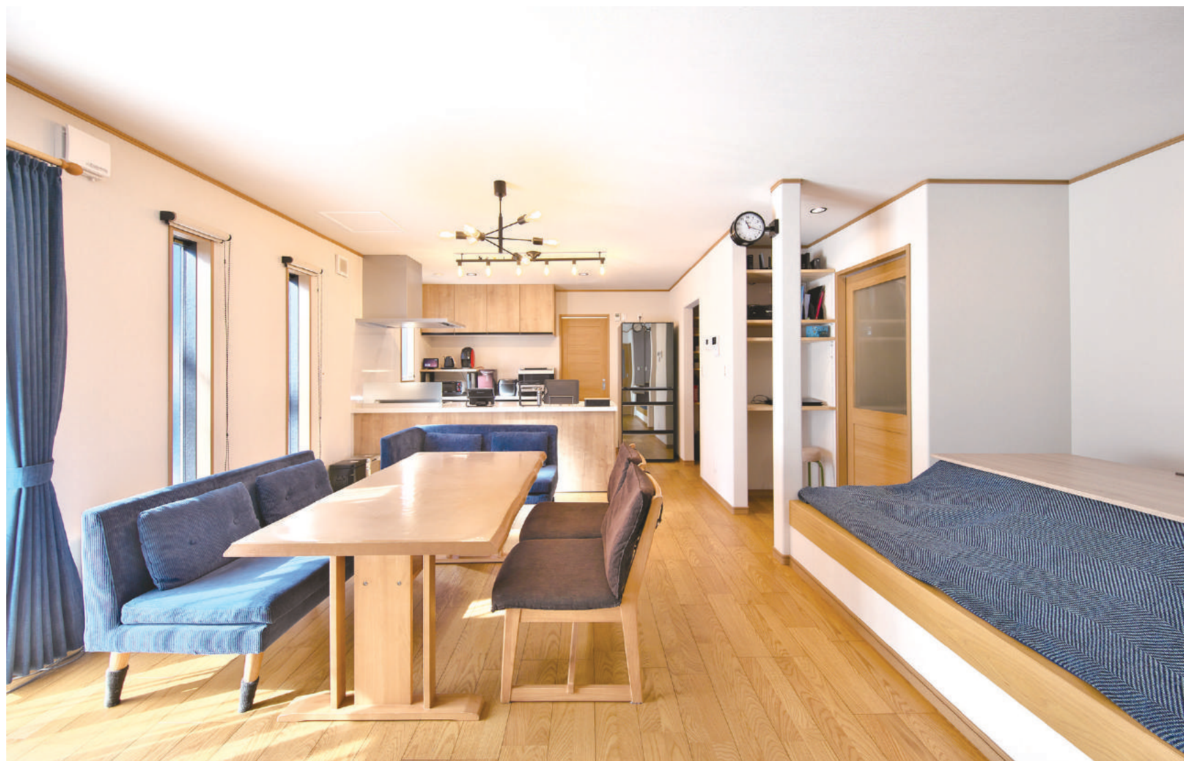
ゆったり広いLDK。明るいナチュラルウッドの空間にブルーのファブリックをコーディネート。小上がりの畳コーナーにコタツを置いてくつろぐ