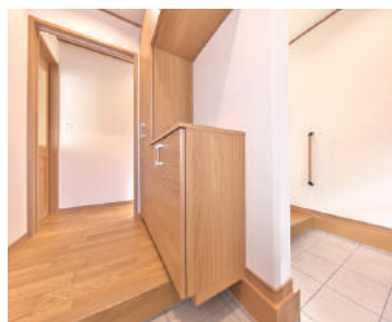
家族と来客の動線を分けた2way仕様の玄関ホール