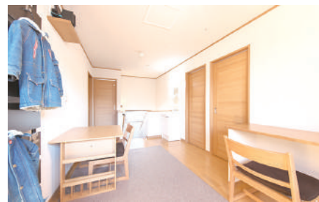
2階ホールは子どもたちのフリースペースとして活用