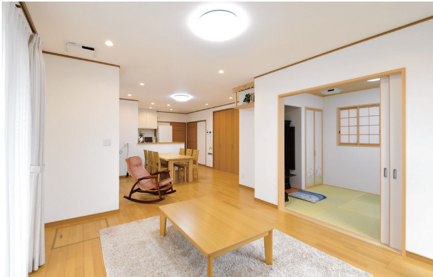
天井が高く明るく快適な空間が広がる1階のLDK。引き戸を開ければ、くつろぎの和室とつながる