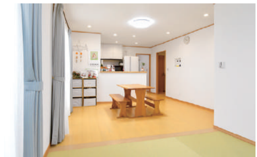
子育てがしやすいようにリビングに畳を敷き、落ち着いた雰囲気になった2階のLDK

1階のLDKは約22畳分の広さがあり、リビング横の和室(4.5畳)を加えると、空間はさらに広がる。リビングの南面は天井まで届く掃き出し窓で、採光や風通しに欠かせないアイテムとなっている。お母さんのお気に入りには、「玄関-リビング-キ