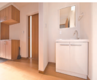
帰宅後に手洗いやうがいができるように洗面台を備えた玄関ホール

建築したのは、常に長期優良住宅を標準仕様とし、高品質の家を適正価格で提供しているユー