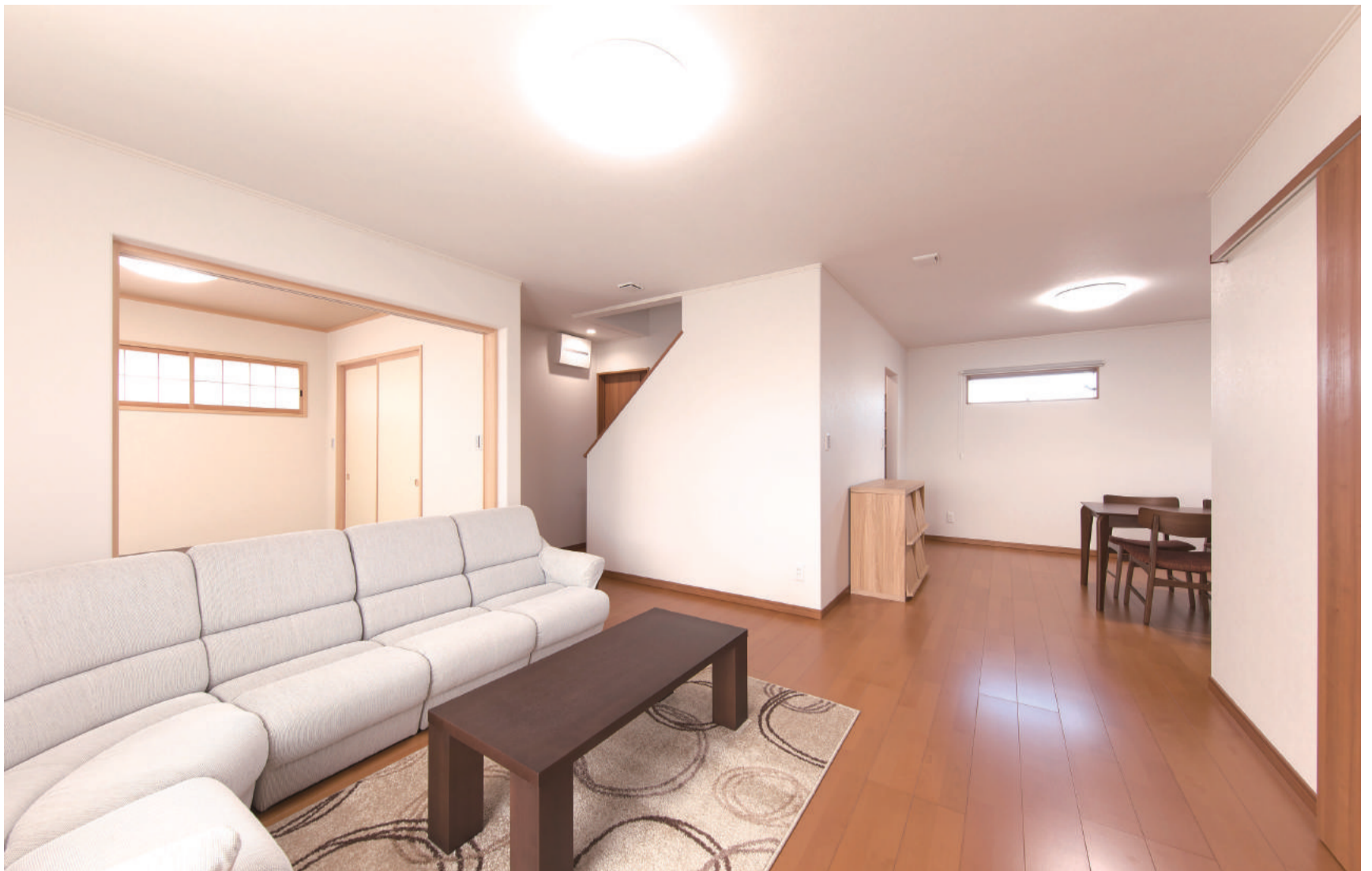
キッチンが見えにくいようにL字型になっているLDK。リビングに隣接する和室の引き戸を開けると、開放感たっぷりの空間が出現する