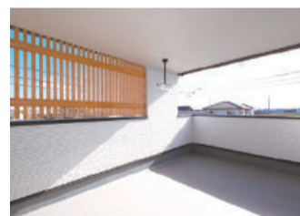
広々とした2階のバルコニー。セカンドリビングとして家族の触れ合いの場にぴったり

できている。収納スペースも玄関の土間収納をはじめ、パントリー、ウォークインクローゼット(2.7畳)など豊富で、和室の畳の下には3つの床下収納を備えており、片付けには全く困らない。さらに魅力的なのが2階の広々としたバルコニーで、セカンドリビングとして家族の触れ合いの場にぴったりだ。