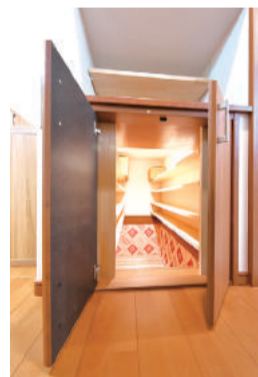
階段下を利用した半地下室は、防災用品の収納や食料の備蓄などに便利

災害に強いのもこの家の特長だ。耐震等級3を取得し、耐震性をはじめ耐久性、省エネ性などに優れているほか、火災に強い省令準耐火構造に