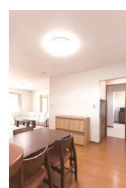
便利な家事動線。水回りが一直線に並んでおり効率よく家事ができる

もう一つ子育て世代にとってうれしいのは、家事のしやすい間取りだろう。キッチン、家事室、ランドリースペース、洗面脱衣室が一直線に並び、リビングへの回遊性も確保。家事動線が実に効率よく