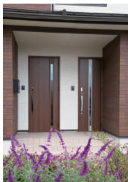
2つの玄関ドアを備えたH邸。住空間も完全分離型になっている

二世帯住宅には完全共有型、一部共有型、完全分離型の3タイプがある。H邸は完全分離型で、2つの玄関ドアを備え、主に2階建て部分は親