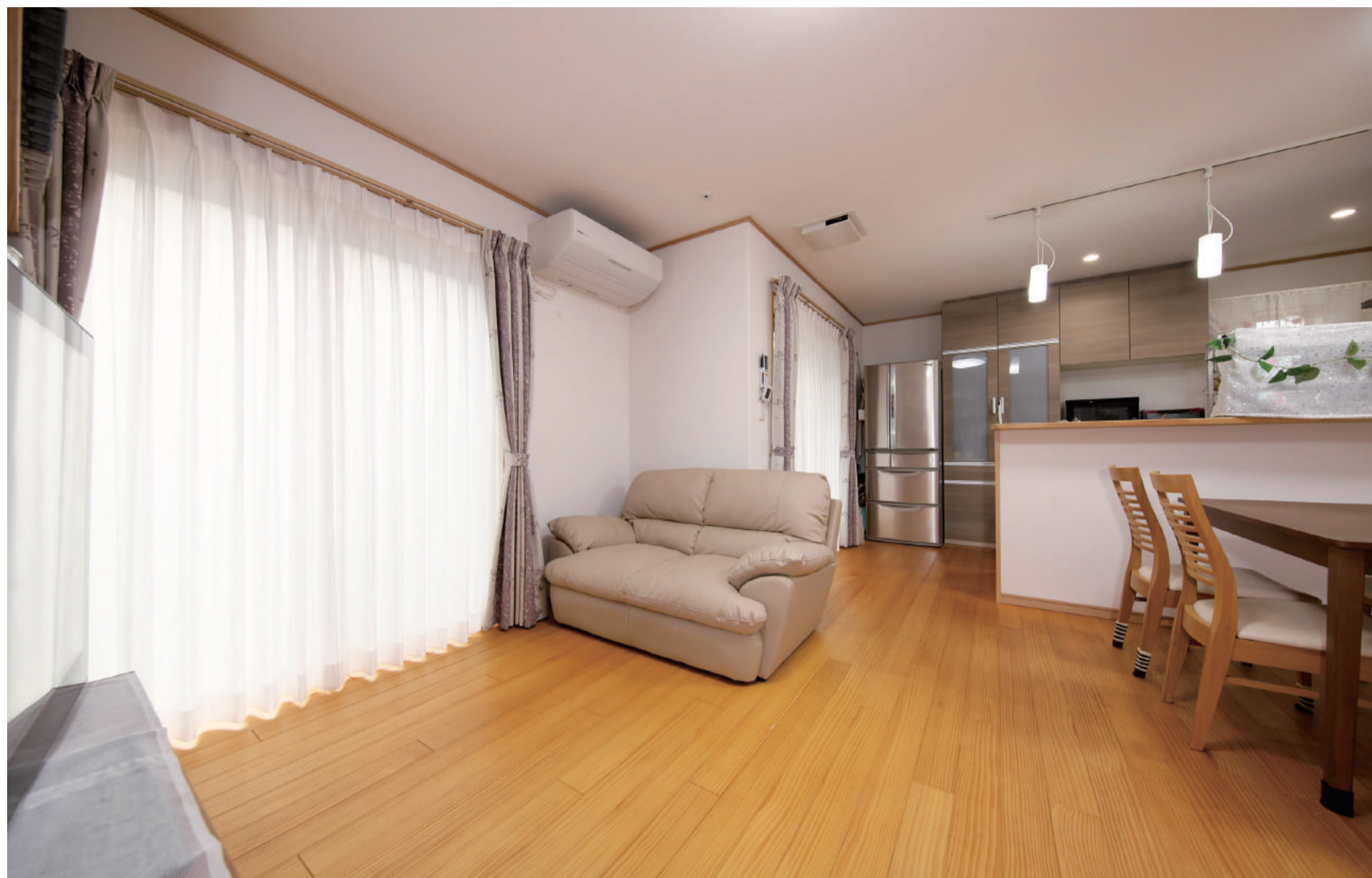
家族団らんの場となっているリビング。無垢の木の床が心地よい