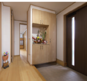
広々とした玄関ホール。祖父母の居住スペース(奥)につながっている

建築したのは高气密・高断熱・高耐震の快適な住まい造りを行っているユーカーホーム浦野建設。期間限定のモデルハウスとして、2年前に建てた2棟のうちの1棟で、北海道並みの優れた断熱性能が大きな特徴。