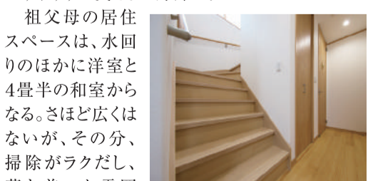
上り下りが楽な幅の広い階段。階段下は収納スペースとして利用

子4人、平屋部分は祖父母の居住スペースとして利用。それぞれにキッチンや浴室などがあり、必要に応じてプライバシーが守られるよう工夫されている。玄関は別々でも、室内に入れば2つの居住スペースはホールでつながっていて簡単に往き来できる。親子4人が暮らすスペースの1階は、間仕切りのないLDKが中心で、対面式のキッチンとともに奥さまのお気に入り。「両親が遊びにくると、リビングはたちまちサロンに早変わりします」と、家族団らんの様子を語る。また、メーターモジュールのおかげで階段の幅が通常より10センチほど広く、家事で頻繁に上り下りする奥さまに好評だ。