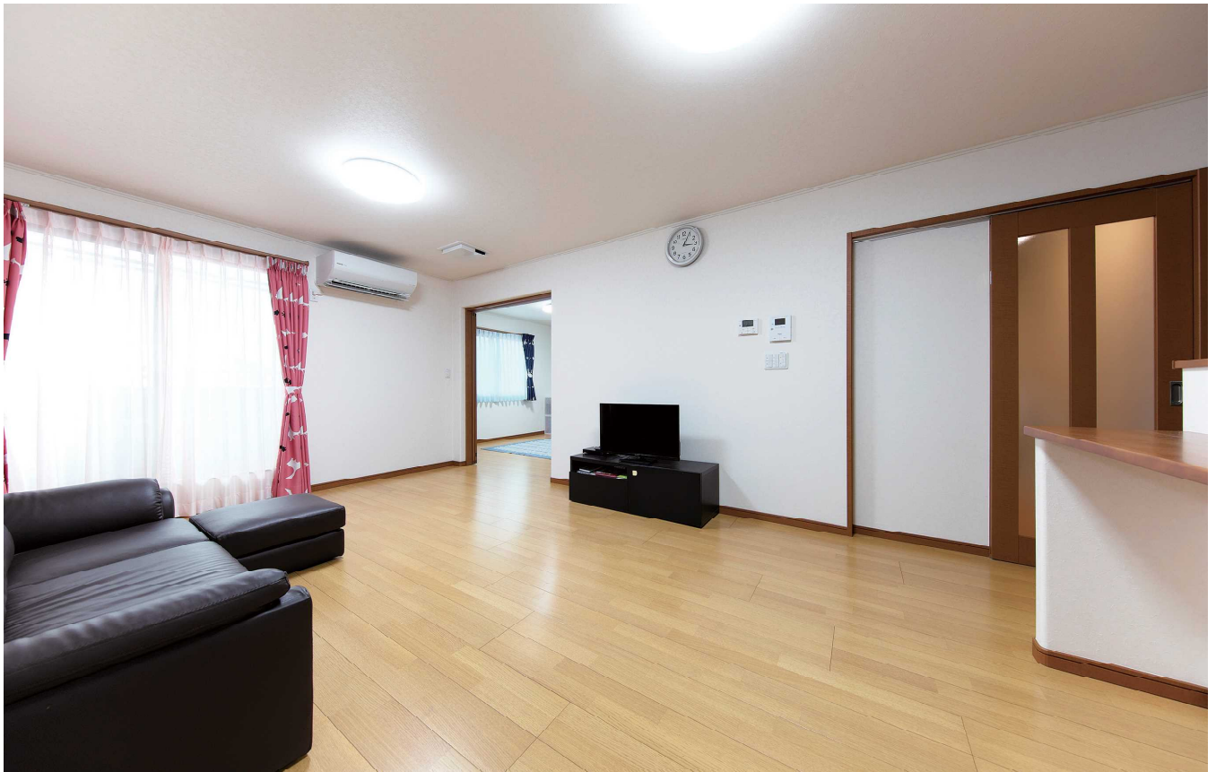
広々とした2階のリビング・ダイニング。奥はご夫妻の主寝室になっている