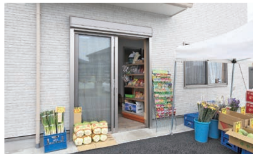
北側の道路に面した店舗部分。玄関ホールで住宅部分とつながっている

木造2階建ての新居は、延べ床面積が約170㎡で、このうち店舗部分は約30㎡と6分の1余りを占める。それでも家族が個室を持ち、ご主人愛用の茶室まである。「間取りや動線が上手にできていて、とても暮らしやすいです」と、ご夫妻は担当者に感謝している。