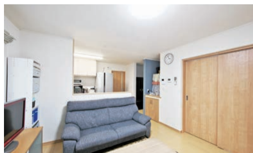
家族団らんの場になっている日当たりの良いリビング。キッチンとの距離が近くて便利だ