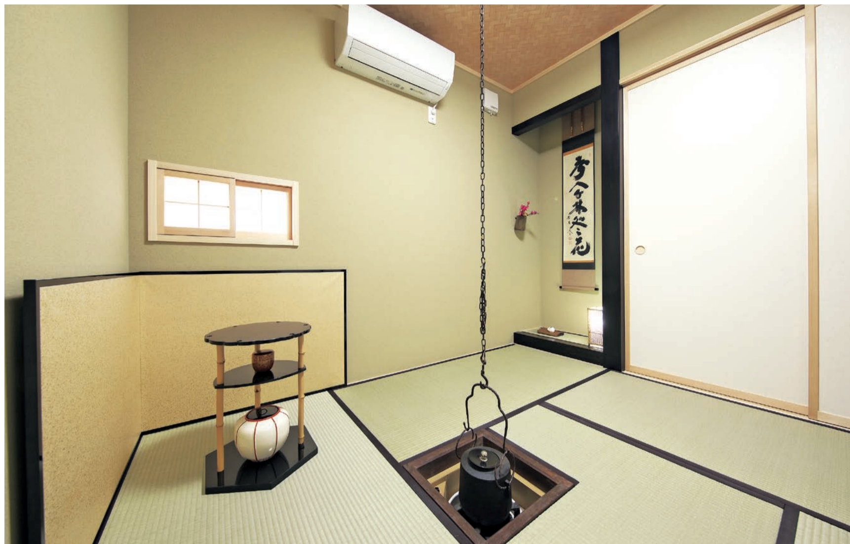
ご主人が愛用している2階の本格的な茶室。炉や掛け軸を飾る床の間も付いている

■ 建築面積 / 93.57㎡ (28.30坪) ■ 延床面積 / 170.58㎡ (51.60坪) ■ 建築工法 / 木造軸組工法 ■ 完成日 / 2019年11月