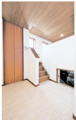
リビングに隣接するスキップフロア(階段の上)。下は半地下の便利な収納スペースになっている

外観。2階の大きな片流れの屋根には、9.15kWの太陽光発電システムを搭載している。