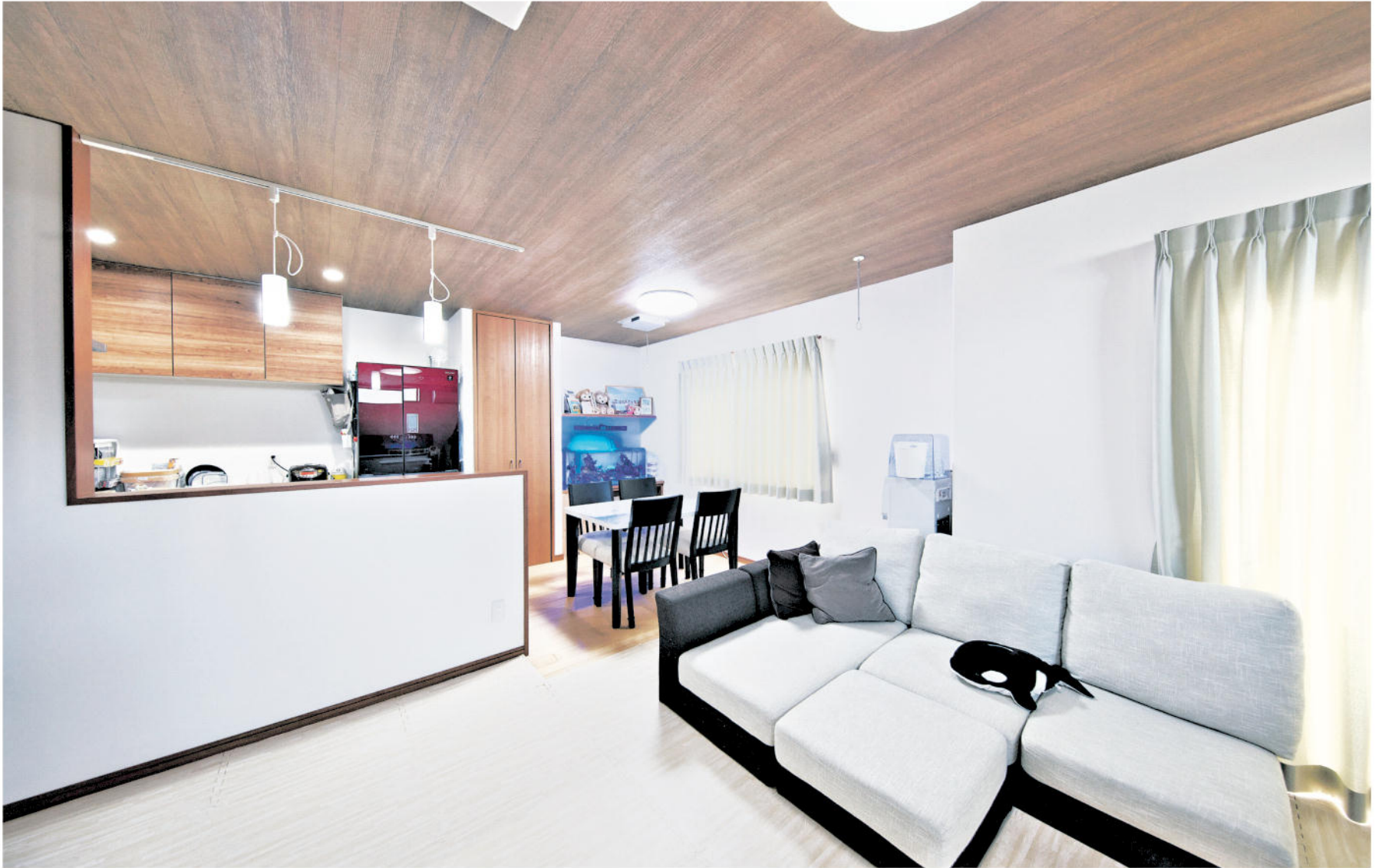
間仕切りがなく広々としたLDK。家族回らんの場にふさわしく落ち着いた雰囲気に包まれている