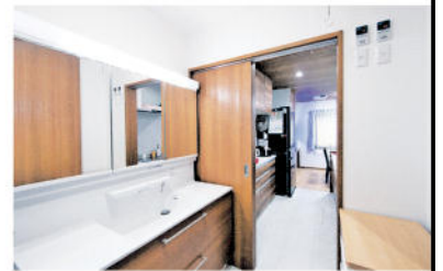
洗面脱衣室(手前)の引き戸を開けると、キッチンからダイニング(奥)へと通じる

衣室、浴室が一直線につながってとても使いやすいです」と奥さま。リビングやダイニングへの回遊性もあり、効率よく家事ができるよう動線が工夫されている。「照明やカーテンなどが完備されていたので、引っ越しもスムーズにできました」と、注文住宅にはないメリットに感謝する。