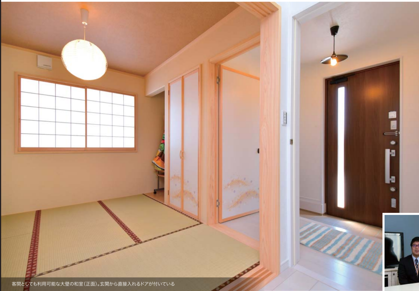
客間としても利用可能な大壁の和室(正面)。玄関から直入れのドアが付いている