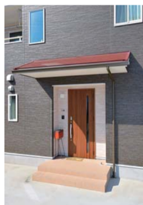
薄墨色の外壁と軒の赤や白のコントラストが目を引く玄関

庭にはご主人の愛車専用のガレージと、広い駐車場が整備されている。「子どもができた後のことや来客のことを考えて、6台分の駐車スペースを確保しました」とご主人。「群馬は1人1台の土地柄ですから」と話す口元に笑みがこぼれた。