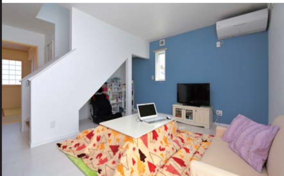
日当たりがよく暖かなリビング。日中はこたつの電気を入れなくても過ごせるほどだ

入居から4カ月。頑丈で快適、しかも家事がしやすく、家計にもやさしいのが子育て住宅の基本。この条件をすべて満たしてくれるマイホームを手に入れたご夫妻は、満足そうに笑みを浮かべた。