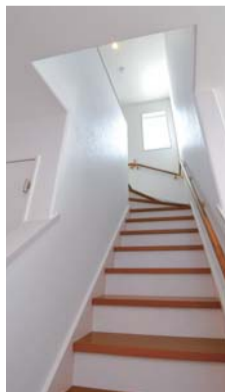
リビング階段の踊り場付近にあるフィックス窓から明るい光が室内に差し込む

室内の天井や壁は、「明るく、広く感じられるように」(奥さま)と、外壁とは対照的に白を基調としている。家族団らんの場となるリビングは、対面式のキッチンやダイニングとの間仕切りがなく、一体となって広々とした空間に。和室(4.5畳)の引き戸を開ければ、開放感がぐんと広がる。リビング階段下を壁で仕切らず、リビングの一部として利用するなど、空間づくりにも工夫を凝らす。共働きの奥さまに好評なのが、便利な家事動線だ。洗面や脱衣室、浴室がサンルームと一直線につながっている。「洗濯したらすぐに室内干しができ、乾いた後は洗面室横のクロゼットにしまうことができます」とうれしそうに話す。