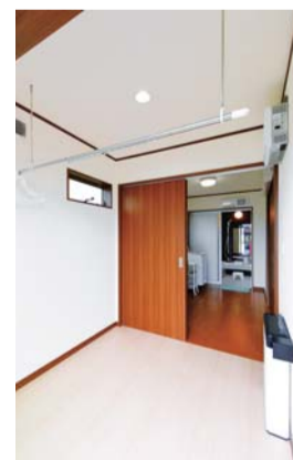
洗濯物の室内干しに便利なサンルーム。洗面脱衣室に隣接している