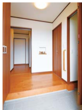
左右に土間収納やクロゼット、シューズクロークを備えたタイル張りの玄関

新居に子ども部屋をしっかりと確保したご夫妻は「マイホームでの子育てを思う存分楽しみたい」と夢を広げている。