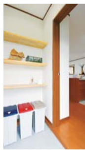
買い物の食料品や野菜などを土足のまま運び込める勝手口の土間収納。奥さまに好評だ

約16畳分の広さを持つ間仕切りのないLDK。隣の和室(4.5畳)の3枚引き戸を開ければ、ゆったりとした開放的な空間がさらに広がる。南に面したお気に入りのサンルームは、浴室、洗面脱衣室と一直線につながっており、洗濯後はすぐに室内干しができる。「これから子どもの洗濯物が増えますが、気になりません」と満面の笑み。