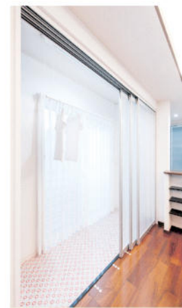
洗濯物を干したり、たたんだりするのに便利なサンルーム

浦野建設はすべて長期優良住宅を標準仕様としている。耐震性や耐久性、省エネルギー性など7項目において国の基準をクリア。火災に強い省令準耐火構造でもある。中でも高気密・高断熱化は同社の得意とするところで、一年を通して室内の温度差を最小限にとどめ、快適な室内環境を維持するノウハウを確立している。