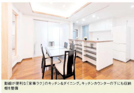
動線が便利な「家事ラク」のキッチン&ダイニング。キッチンカウンターの下にも収納棚を整備

「家事ラク」「掃除ラク」「家計ラク」「メンテラク」という“4つのラク”を合わせ持つZEH(ゼロ・エネルギー