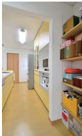
奥さまに好評の大きなパントリー。ほかにも収納スペースはたくさんある

間取りは比較的シンプルだが、巧みに動線を考えた造りになっている。玄関は客人用と家族用の2つの動線がある。真っ直ぐ進めば、ホールからリビングへ、右手に曲がれば土間収納やシューズクロークがあり、キッチン横のパントリー室へと通じる。「たくさん買い物してきた時など、とても便利です」と奥さま。