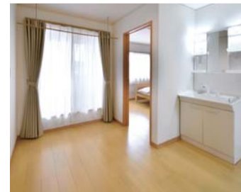
洗濯物の室内干しができる2階の階段ホール。洗面台も置かれていて手洗いに便利

また、土台や柱などの構造材として本県産のスギやヒノキを多用したおかげで県から40万円、地域型