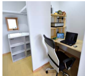
ウォークインクローゼットに設けられたご主人の書斎コーナー。静かな環境で読書ができる

「経済的なやさしさ、もこの家の特長だ。オール電化で、屋根には約5㎡の太陽光発電設備を搭載。LED照明や省エネ型のエアコンなどを使用することで消費電力を抑え、売電による黒字分の収入が家計の助けになっている。