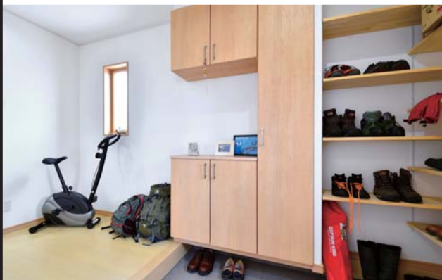
土間収納とシューズクロークを備えた家族用の玄関。ホールにはご主人専用の運動器具が置かれている

パートナーに選んだのは、長期優良住宅を得意とするユーケーホーム浦野建設。同社は高气密・高断熱に加え、耐震性や耐久性に優れた家づくりを行っており、ゼロエネの二世帯住宅でも実績を重ねている。「必ずや私たちの希望をかなえてくれると思いました」とご夫妻は振り返る。