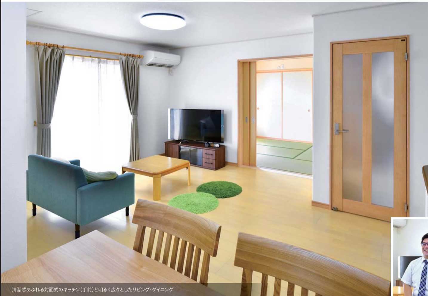
清潔感あふれる対面式のキッチン(手前)と明るく広々としたリビング・ダイニング