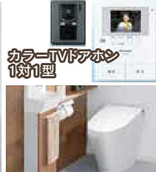
カラーTVドアホン 1対1型 タンクレストイレ