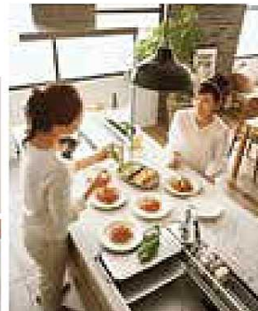
システムキッチン