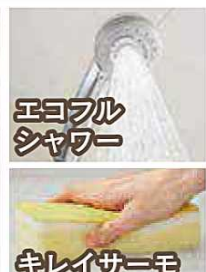
エコフルシャワー キレイサーモフロア