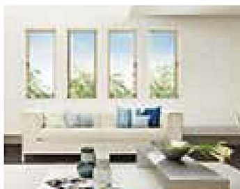
アルミ樹脂複合窓