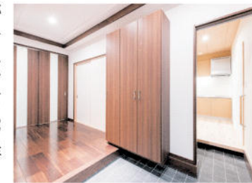
親世代の居住空間に向かう土間と広縁。正面にはミニキッチンが備える