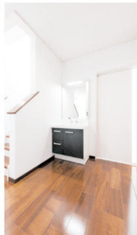
幅2.1メートルの廊下の突き当たりがトイレと洗面所。段差がなく車いすでも楽々