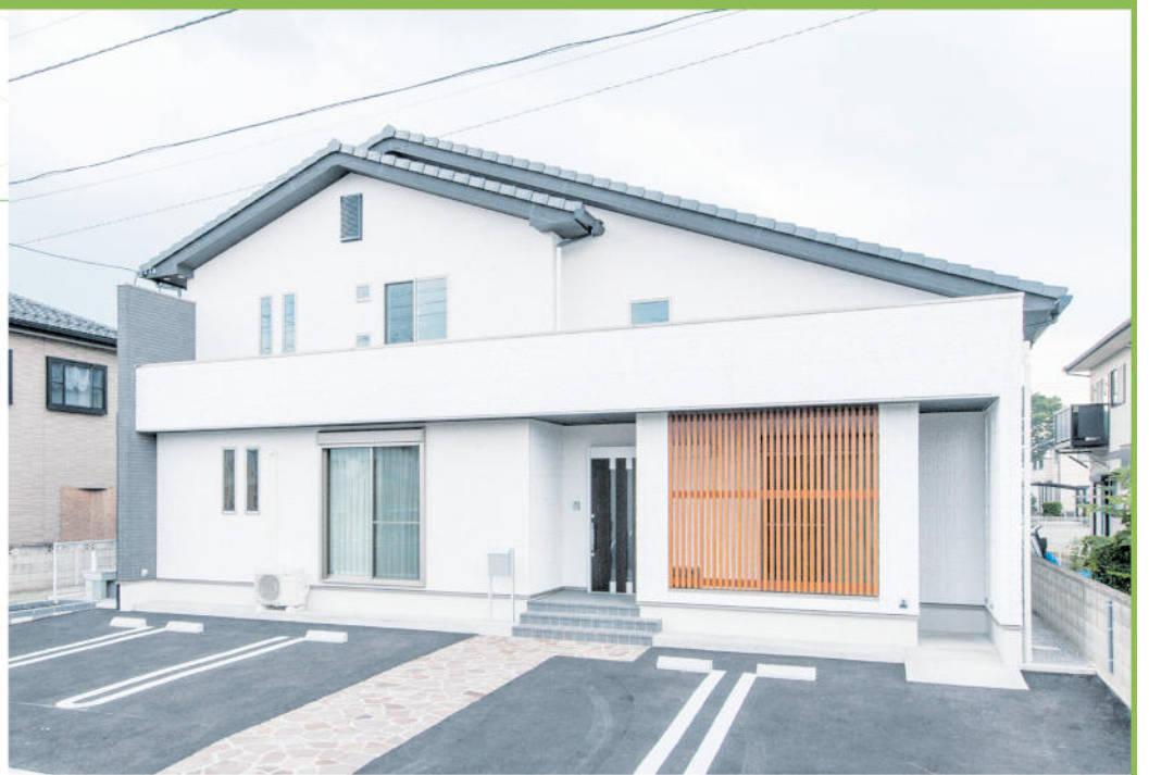
耐震性や耐久性に優れた長期優良の二世帯住宅。重厚感のある外観が目を引く

2階は子ども世代の居住空間で、主寝室と孫の勉強部屋などがある。注目は約8畳分の広さをもつ小