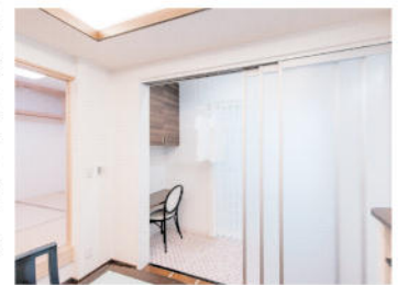
ダイニングの横にあるサンルーム。洗濯物の室内干しに便利

「自由設計の注文住宅」を基本に、高品質の家を適正価格で提供している浦野建設。ユーザーの負担を軽減するため公的補助金の利用にも積極的で、このモデルハウスも「地域型住宅グリーン化事業」の対象として、国から100万円が支給される。