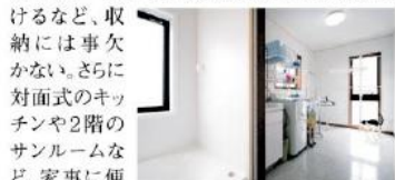
▲洗面脱衣室を兼ねた便利なサンルーム

当初の設計では浴室だったキッチン横のスペースを大きなパントリーに変更。2階主寝室の奥にウォークインクローゼット、階段下に物置を設けるなど、収納には事欠かない。さらに