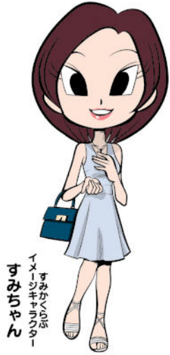
すみかくらぶ イメージキャラクター すみちゃん

(〒371-8666) 前橋市古市町1-50-21 TEL.027-254-9951 FAX.027-253-9999 http://www.sumikaclub.com E-mail:sumika@raijin.com