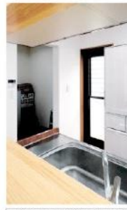
▲冷房庫も設置した奥棟にお気に入りの大きなパントリー

室内は1、2階とも壁・天井が白で統一され、明るい雰囲気に包まれている。設計の際に奥