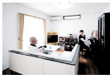
▲奥さまの弾くピアノを聴きながらリビングでくつろくご主人

しかし、「出来上がってみると、2階の浴室もいいものです」とご夫妻。「窓を開けていても近隣の視線を気にしなくてすむので、星空を眺めながらゆっくり湯に漬かれます」とご満悦の様子。