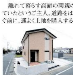
▲南北の空いた敷地は駐車場として整備されている

離れて暮らす高齢の両親のことが気になっていたというご主人。道路をはさんだ実家のすぐ前に、運よく土地を購入することができた。近くに住めば、両親の面倒をみることができると考え、その土地にマイホームを建てることを決意した。「来年4月から消費税アップが予定されており、タイミング的にもいいと思いました」とご主人は振り返る。