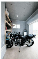
▲オートバイやスクーターなどの愛車を収納したビルトインガレージ

玄関ドアを開けて中に入ると、3つの動線が目に入る。右手は趣味の部屋、左手は将来の子ども部屋、正面の階段はリビングへと通じる。また、右の壁に取り付けられたドアを開ければガレージに、左ドアの向こうは着替えのできる収納スペースにつながっている。