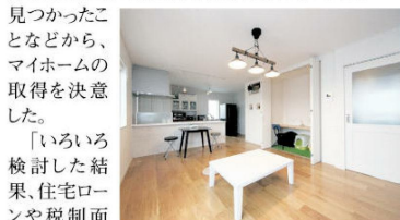
▲白で統一した室内は明るく開放感にあふれている

ご夫妻は大のネコ好きで、新居に引っ越す前は、ペットが飼えるアパートに住んでいた。しかし、飼いネコが3匹に増えて居場所が手狭になったこと、奥さまの実家近くに手ごろな土地が見つかったことなどから、マイホームの取得を決意した。