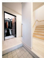
▲3つの動線を持つ玄関。左手ドアの奥は着替えのできる収納スペース

「いろいろ検討した結果、住宅ローンや税制面でさまざまな優遇措置が受けられる長期優良住宅を選びました」とご主人。施工については、長期優良住宅を得意とし、地域に根差したビルダーとして多くの実績と高い信頼を得ている浦野建設にお願いした。