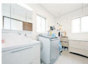
▲広くてゆったりとした洗面所。洗濯などの家事が楽々

リビングの窓からは、遠く山並みが見渡せる。「周囲の視線を気にすることなく生活できる2階リビングは最高です」と、ご夫妻は新居での暮らしをエンジョイしている。