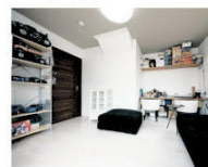
▲趣味の部屋はご夫妻のくつろぎの場となっている

対面式のキッチン、ダイニング、リビングは間仕切りのないワンフロアになっており、壁面を白